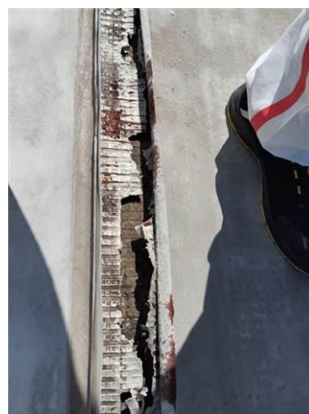
Matériaux : Z05: Partie plane de la toiture-terrasse Prélèvement : P005 Description : Complexe étanchéité + enduit Localisation : Batiment 002 / Toit - Toiture plane Résultat : Absence d'amiante