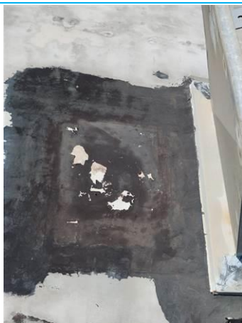
Matériaux : Z03: Trappe de la toiture-terrasse - Pièce de rapiéçage - Matériau bitumineux noir Prélèvement : P003 Description : Complexe étanchéité Localisation : Batiment 002 / Toit - Trappe base - Pièce de rapiéçage Résultat : Présence d'amiante