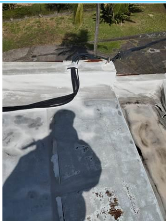
Matériaux : Z01: Acrotère toiture-terrasse Prélèvement : P001 Description : Complexe étanchéité + enduit Localisation : Batiment 002 / Toit - Acrotère Résultat : Absence d'amiante