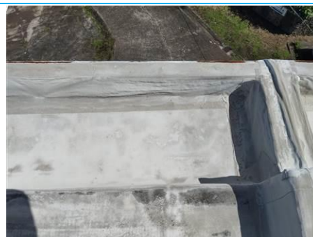
Matériaux : Z02: Chaîneau de la toiture-terrasse Prélèvement : P002 Description : Complexe étanchéité + enduit Localisation : Batiment 002 / Toit - Chaîneau Résultat : Absence d'amiante