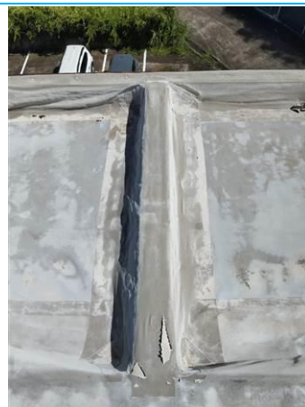
Matériaux : Z04: Partie relevé de la toiture-terrasse Prélèvement : P004 Description : Complexe étanchéité + joint Localisation : Batiment 002 / Toit - Relevé toiture Résultat : Absence d'amiante