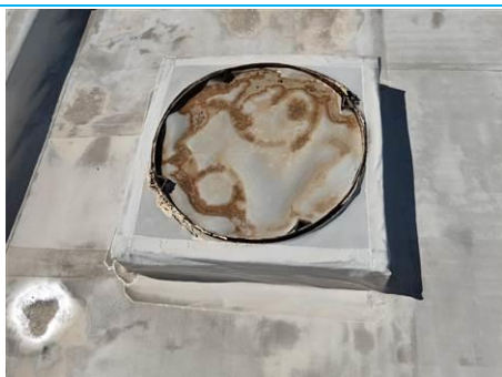
Matériaux : Z06: Trappe ronde Prélèvement : P006 Description : Joint Localisation : Batiment 002 / Toit - Trappe ronde Résultat : Absence d'amiante